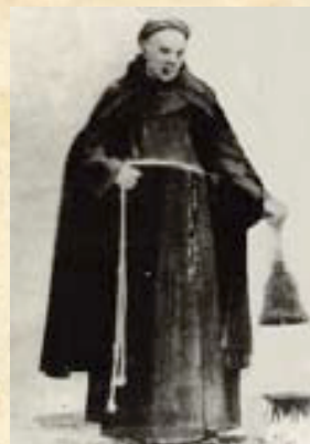
(3) Fray Luis Beltrán. Multiplicó la producción de armamento en tiempo récord.