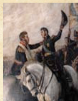
(12) El General O'Higgins abraza al General San Martín poco antes de culminar la batalla de Maipú. Ambos son responsables de tamaña victoria. Fragmento del óleo de Pedro Subercaseaux, MHN 1908.