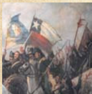
(13) Quedaba consolidada la libertad de dos pueblos hermanos. Fragmento del óleo de Pedro Subercaseaux, MHN 1908.