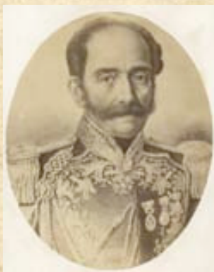
(5) General Juan Las Heras. Su División y el Batallón N° 11 dieron ejemplo de coraje y valor. No fue casualidad que Ordóñez terminara rindiéndose ante él.