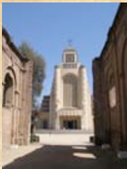
(19) Foto en la cual se puede apreciar la antigua construcción ordenada por el Director Supremo O'Higgins y la moderna (en el fondo).