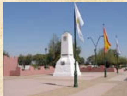
(15) Monumento emplazado sobre el sector real donde se produjo el famoso "Abrazo de Maipú". (Fotos actuales del campo de batalla).