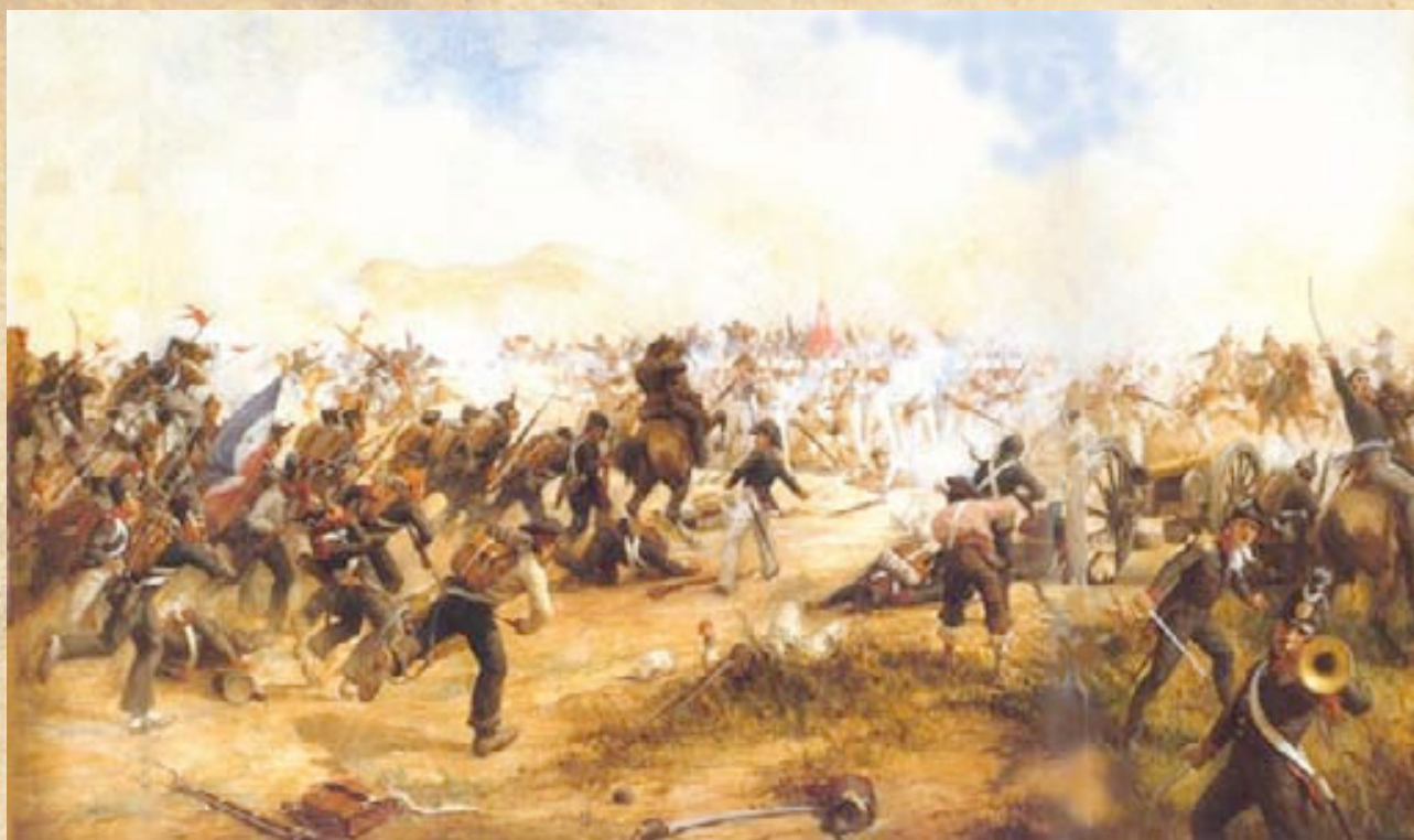
(10) Los batallones de infantería patriotas empezaron a desequilibrar el frente en el ala derecha realista. Óleo de Pedro Subercaseaux, MHN de Chile.