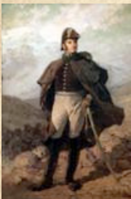
(4) General José de San Martín. El constituir y preservar una fuerte reserva le dio la llave del éxito en Maipú.