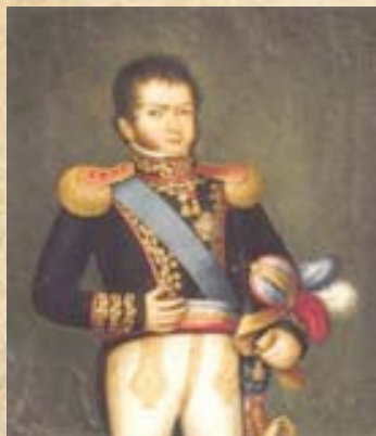
(1) General Bernardo O'Higgins. A pesar de su herida en el brazo, llegó a Santiago y fue el principal reconstructor del Ejército Unido.