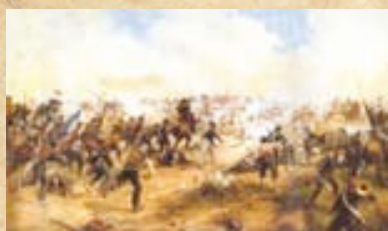
(10) Los batallones de infantería patriotas empezaron a desequilibrar el frente en el ala derecha realista. Óleo de Pedro Subercaseaux, MHN de Chile.