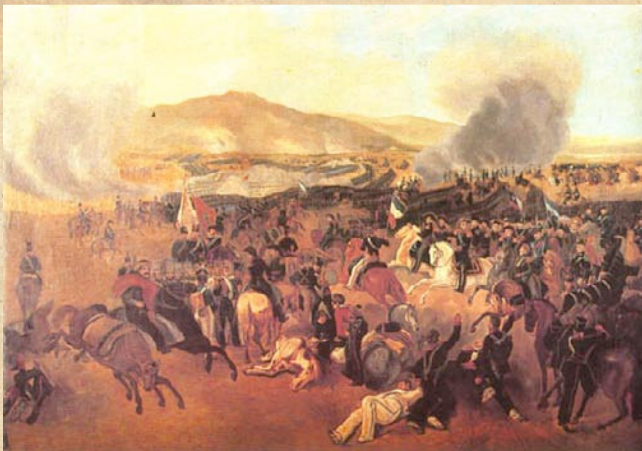
(9) Con el arribo de las unidades de la reserva al sector sureste del frente, la amenaza realista empezó a ceder terreno. Óleo de Mauricio Rugendas, 1836 MHN de Chile.