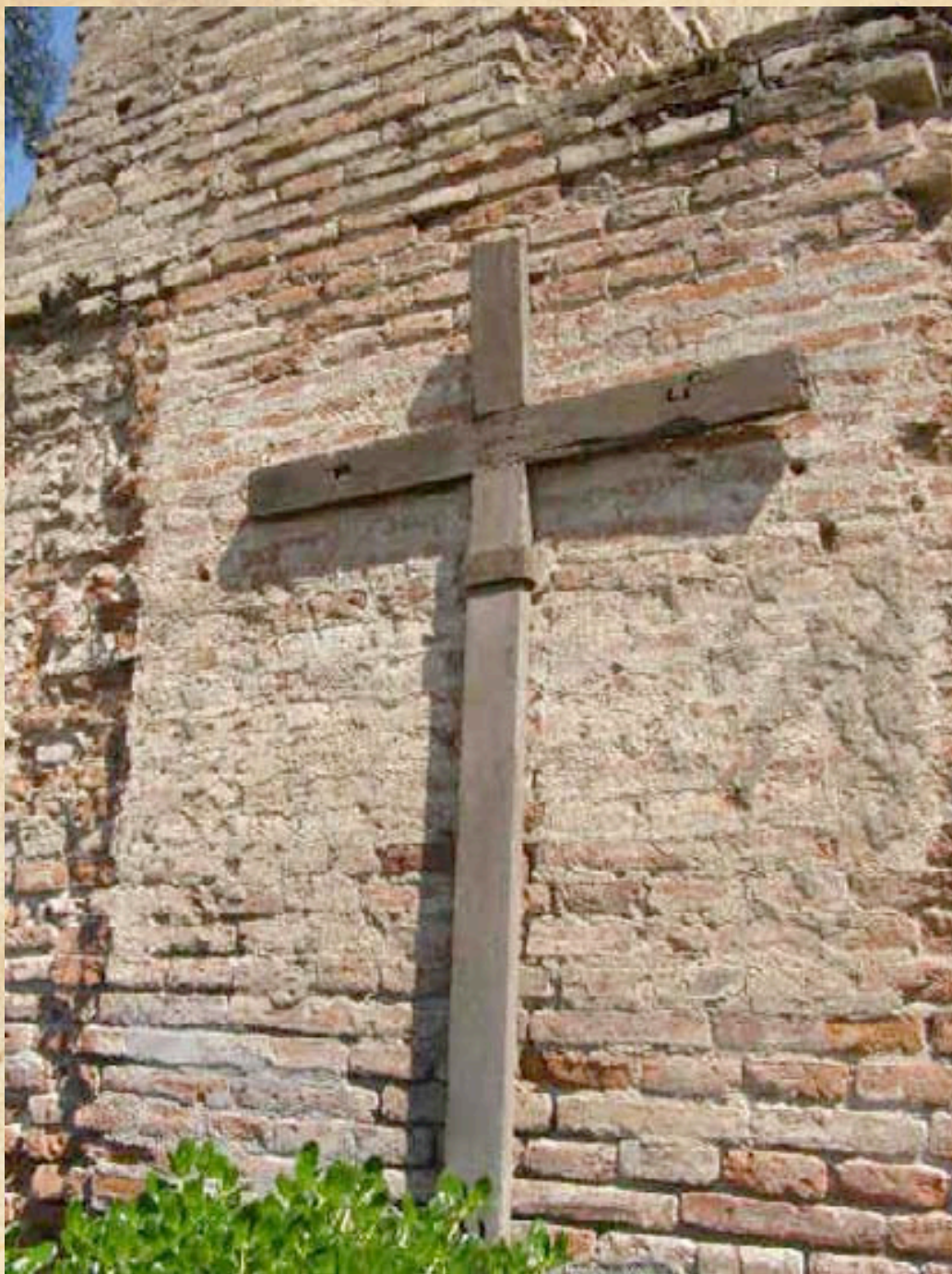
(18) Antiguamente el Brigadier O'Higgins hizo construir un Templo Votivo en agradecimiento a la Virgen del Carmen, promesa a la que dio entero cumplimiento. (Fotos actuales del campo de batalla).