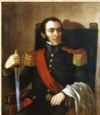
(2) Brigadier Mariano Osorio. Aceptó la batalla que le propuso el GrI San Martín al norte del río Maipo. Entonces el 5 de abril de 1818, fue completamente derrotado.