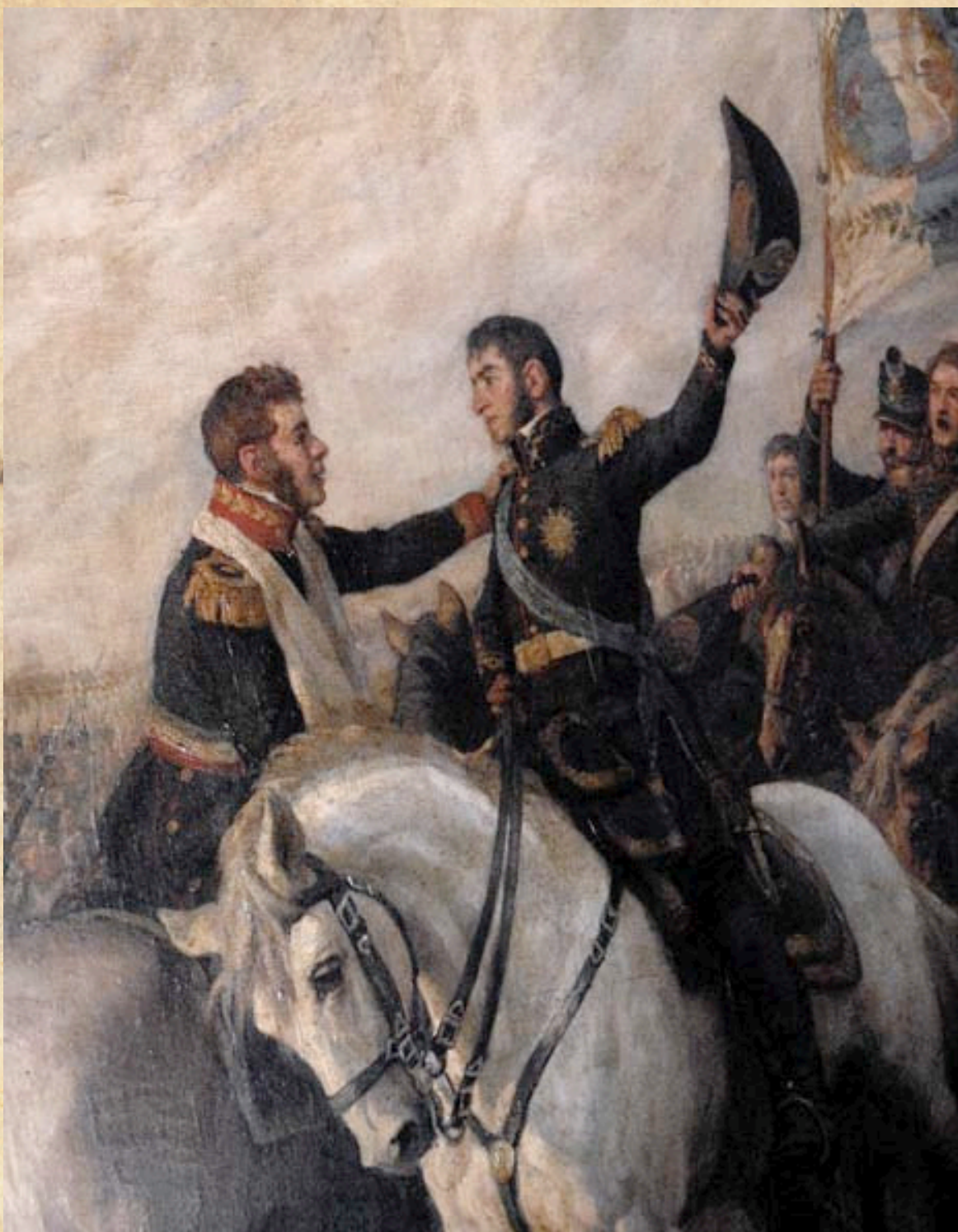
(12) El General O'Higgins abraza al General San Martín poco antes de culminar la batalla de Maipú. Ambos son responsables de tamaña victoria. Fragmento del óleo de Pedro Subercaseaux, MHN 1908.