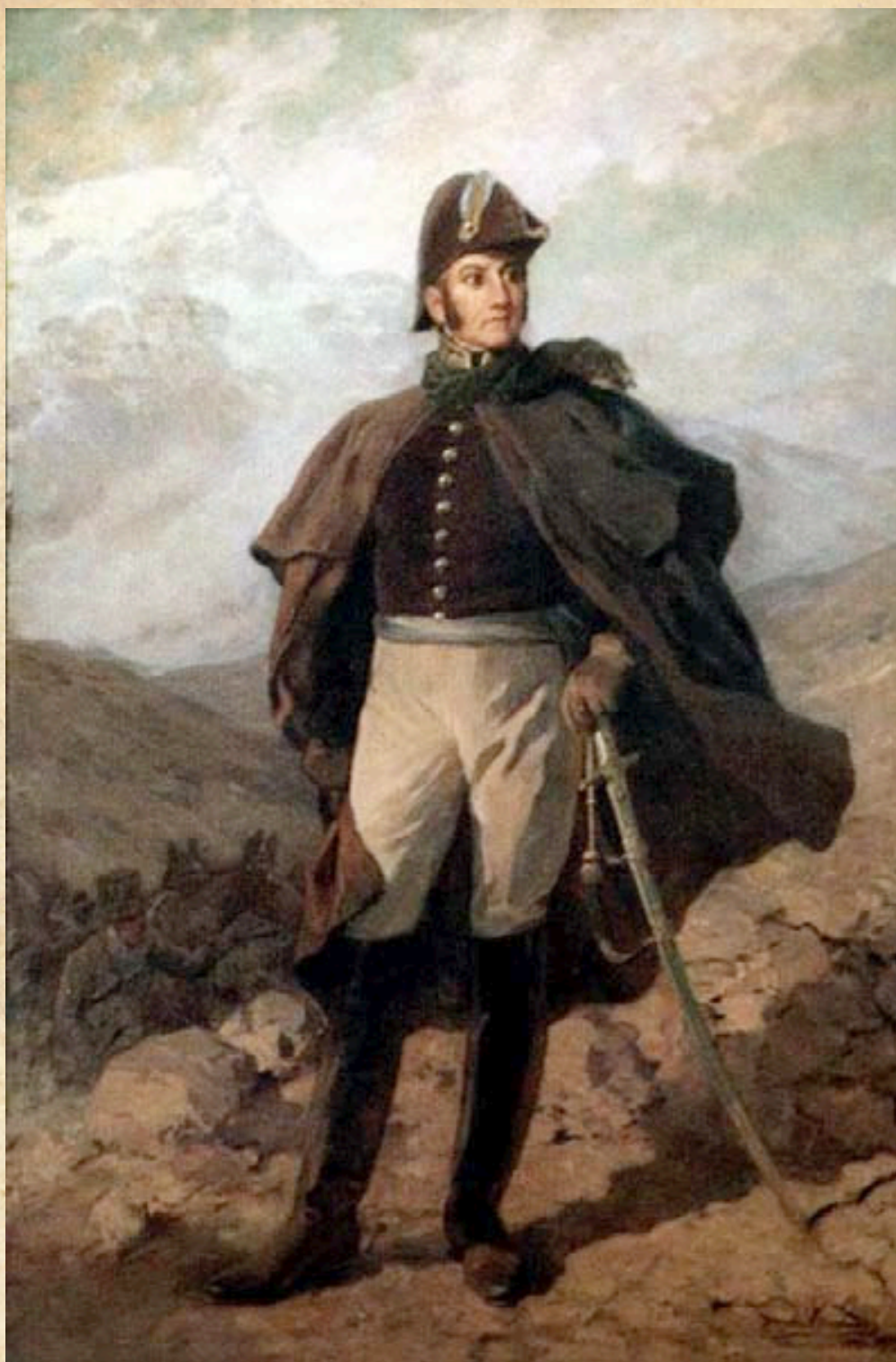
(4) General José de San Martín. El constituir y preservar una fuerte reserva le dio la llave del éxito en Maipú.