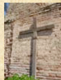
(18) Antiguamente el Brigadier O'Higgins hizo construir un Templo Votivo en agradecimiento a la Virgen del Carmen, promesa a la que dio entero cumplimiento. (Fotos actuales del campo de batalla).