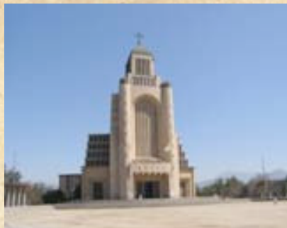
(20) Otra toma del moderno Templo Votivo, en agradecimiento a la Virgen del Carmen por la victoria de Maipú. (Fotos actuales del campo de batalla).