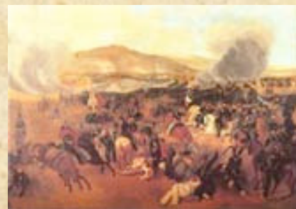
(9) Con el arribo de las unidades de la reserva al sector sureste del frente, la amenaza realista empezó a ceder terreno. Óleo de Mauricio Rugendas, 1836 MHN de Chile.