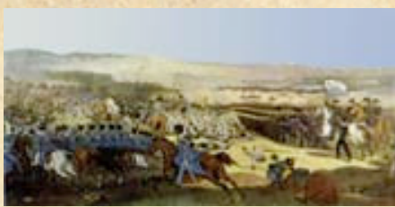
(11) Los Cazadores a Caballo persiguieron a los restos del ala derecha real, que también se retiraron hacia la Hacienda de Lo Espejo.