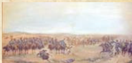
(8) Los Granaderos a Caballo tratan de cortar la retirada de los cazadores y granaderos reales que descienden del Cerro Errázuriz. Óleo de Fernández Villanueva (Giotto Lamponi – Museo RGC)