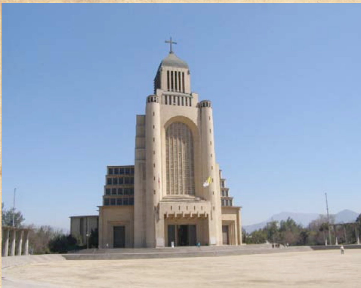
(20) Otra toma del moderno Templo Votivo, en agradecimiento a la Virgen del Carmen por la victoria de Maipú. (Fotos actuales del campo de batalla).