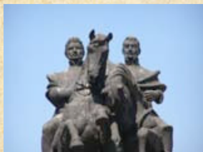
(14) La amistad entre O'Higgins y San Martín quedó sellada tras concluir exitosamente la campaña.