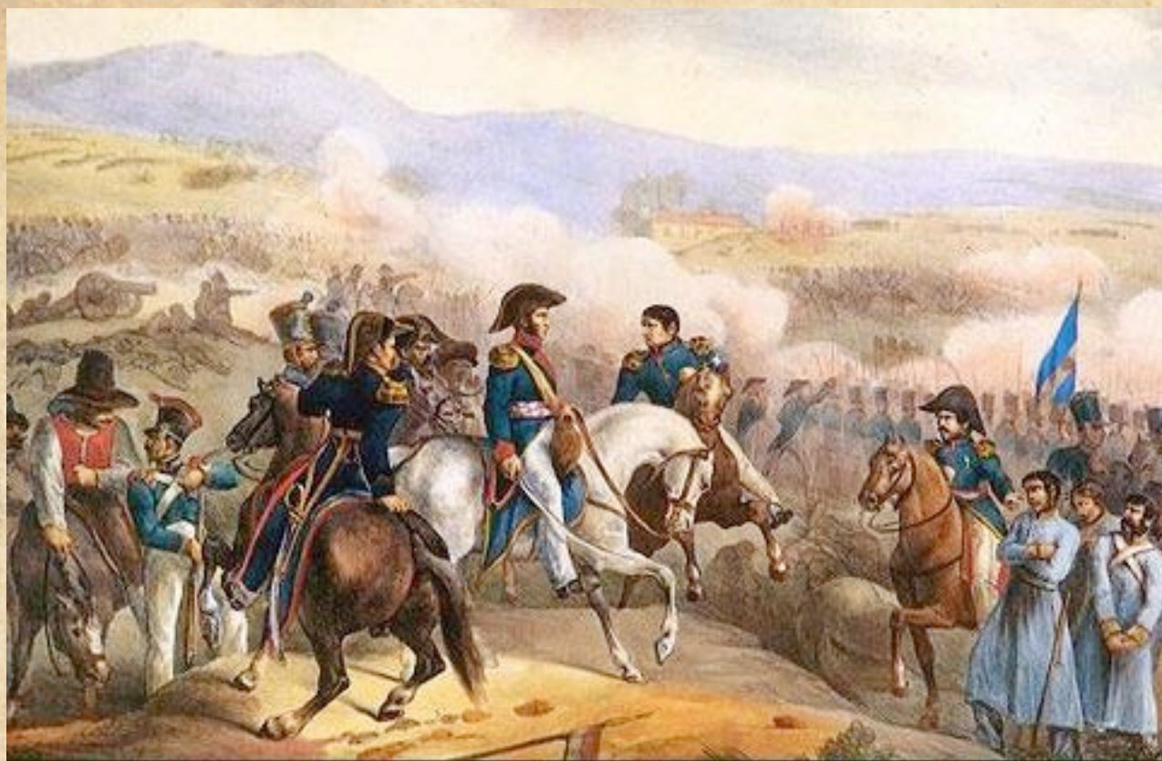
(16) Momento de la batalla de Maipú, en el que le son expuestos prisioneros realistas al General San Martín. Litografía coloreada de Theodore Gericault c. 1819.