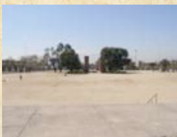
(17) Sobre las planicies amesetadas se levanta hoy un complejo de monumentos alusivos a la batalla de Maipú. (Fotos actuales del campo de batalla).