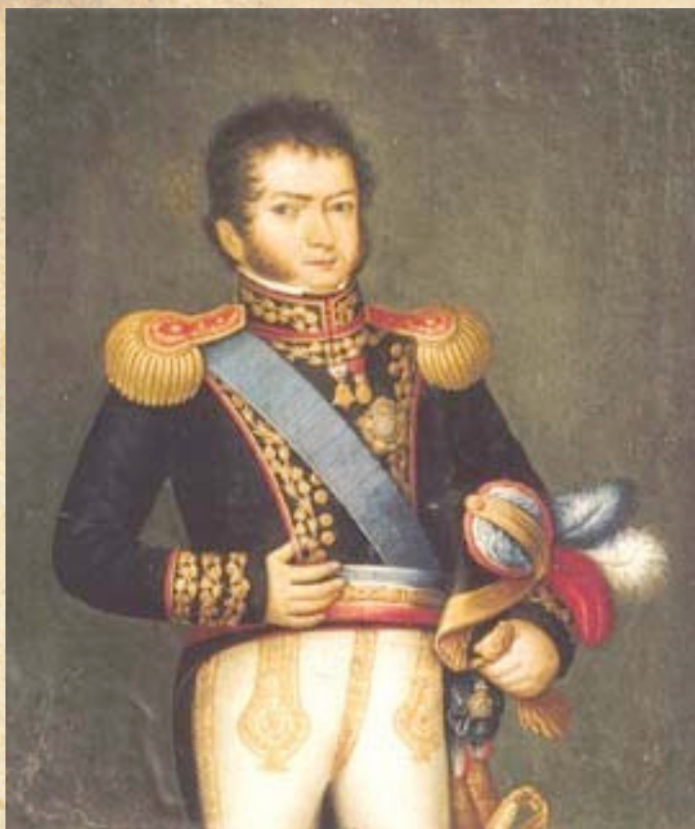
(1) General Bernardo O'Higgins.

A pesar de su herida en el brazo, llegó a Santiago y fue el principal reconstructor del Ejército Unido.