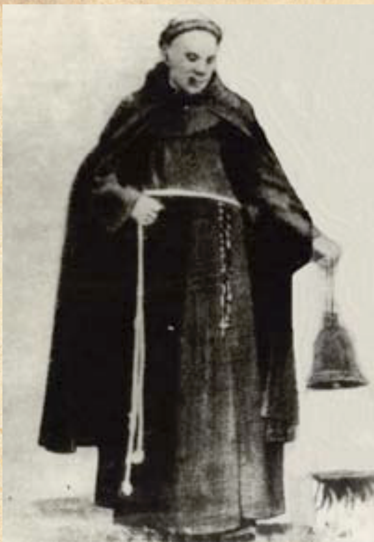
(3) Fray Luis Beltrán. Multiplicó la producción de armamento en tiempo récord.