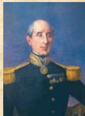
(6) Almirante Manuel Blanco Encalada. Era un eximio marino. Durante la campaña a Chile condujo con brillantez a la Artillería patriota.