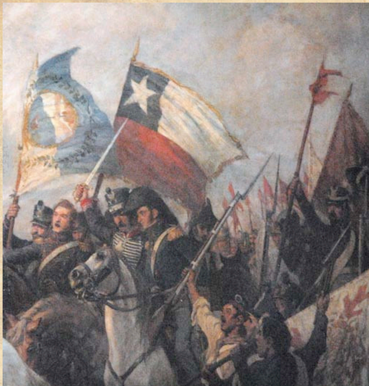
(13) Quedaba consolidada la libertad de dos pueblos hermanos. Fragmento del óleo de Pedro Subercaseaux, MHN 1908.