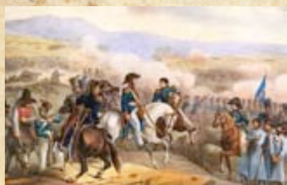
(16) Momento de la batalla de Maipú, en el que se exponen prisioneros realistas al General San Martín. Litografía coloreada de Theodore Gericault c. 1819.