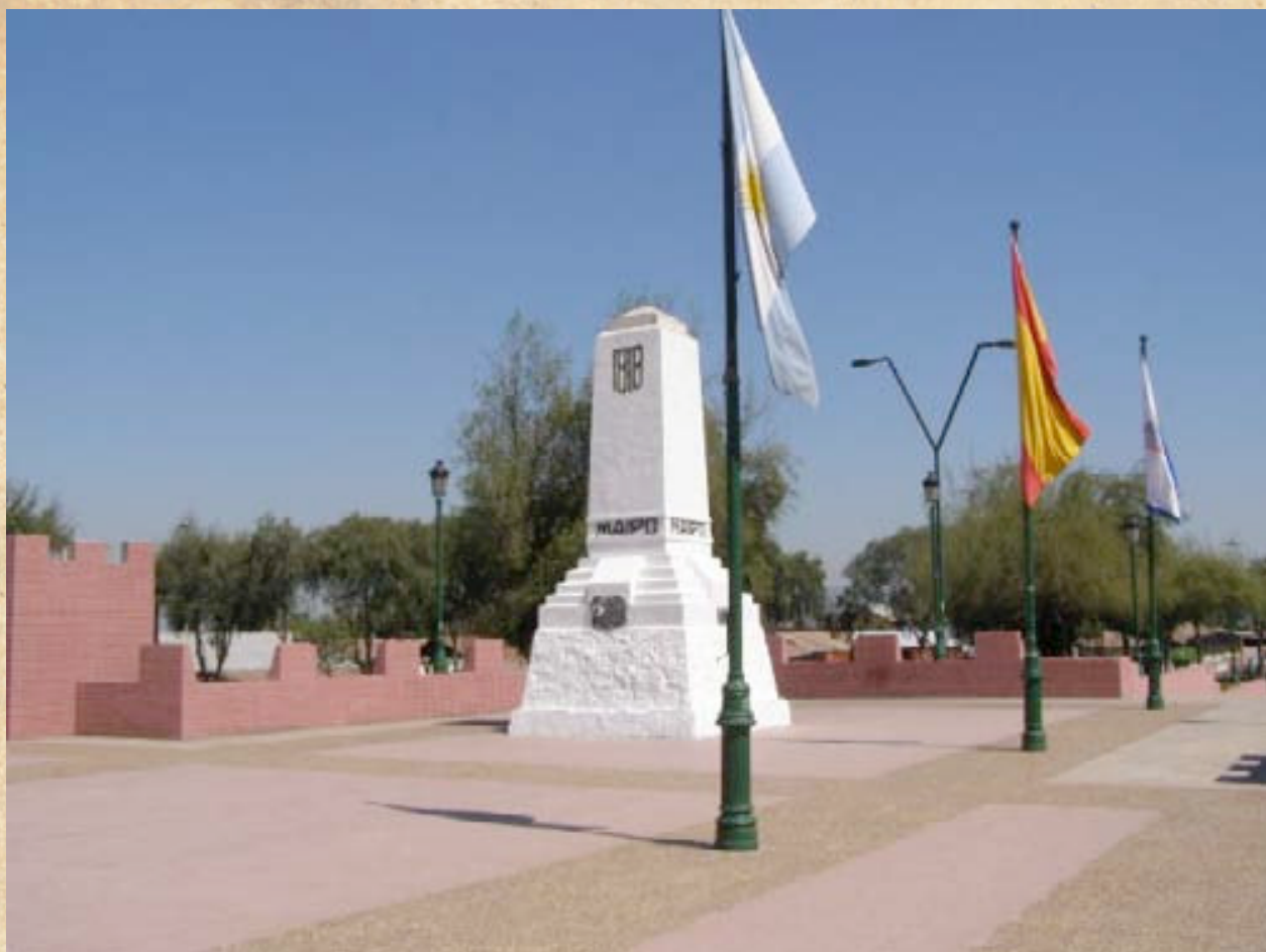
(15) Monumento emplazado sobre el sector real donde se produjo el famoso "Abrazo de Maipú". (Fotos actuales del campo de batalla).