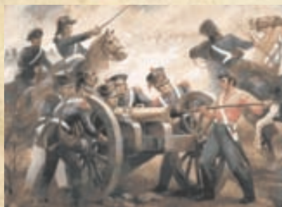
(7) A las 11:30 Hs, San Martín ordenó a la artillería patriota del centro, que entre en acción en Maipú.