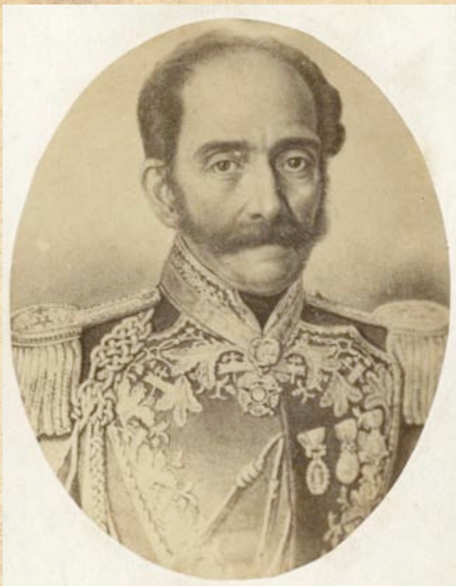
(5) General Juan Las Heras. Su División y el Batallón N° 11 dieron ejemplo de coraje y valor. No fue casualidad que Ordóñez terminara rindiéndose ante él.