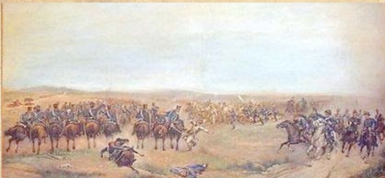
(8) Los Granaderos a Caballo tratan de cortar la retirada de los cazadores y granaderos reales que descienden del Cerro Errázuriz. Óleo de Fernández Villanueva (Giotto Lamponi – Museo RGC)