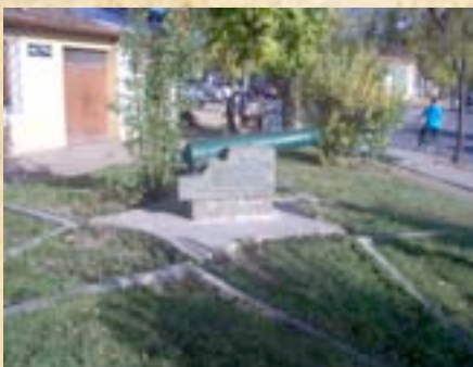
(16) Hoy día la ciudad de Talca se ha extendido sobre la que fuera la llanura de Cancha Rayada. (Fotos actuales del campo de combate).