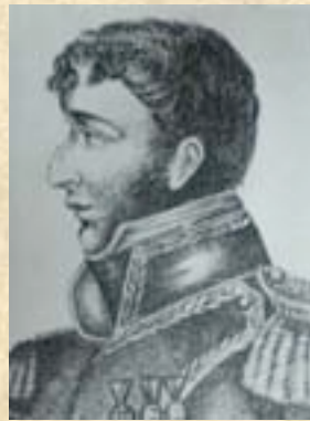
(5) General Antonio González Balcarce.