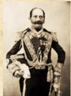
(9) General Juan Gregorio de Las Heras. Fue el héroe de la triste jornada de Cancha Rayada, salvó a una División con 3.500 hombres que condujo intactos a Santiago de Chile.