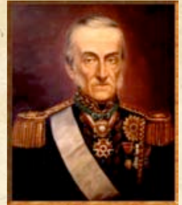
(12) Brigadier General Rudecindo Alvarado. Fue Jefe del Batallón Nº 1 "Cazadores de Los Andes", su Batallón escapó hábilmente entre las unidades realistas, aprovechando la confusión.