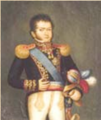
(1) General Bernardo O'Higgins. Fue herido en el brazo, mientras conducía heroicamente a su División.