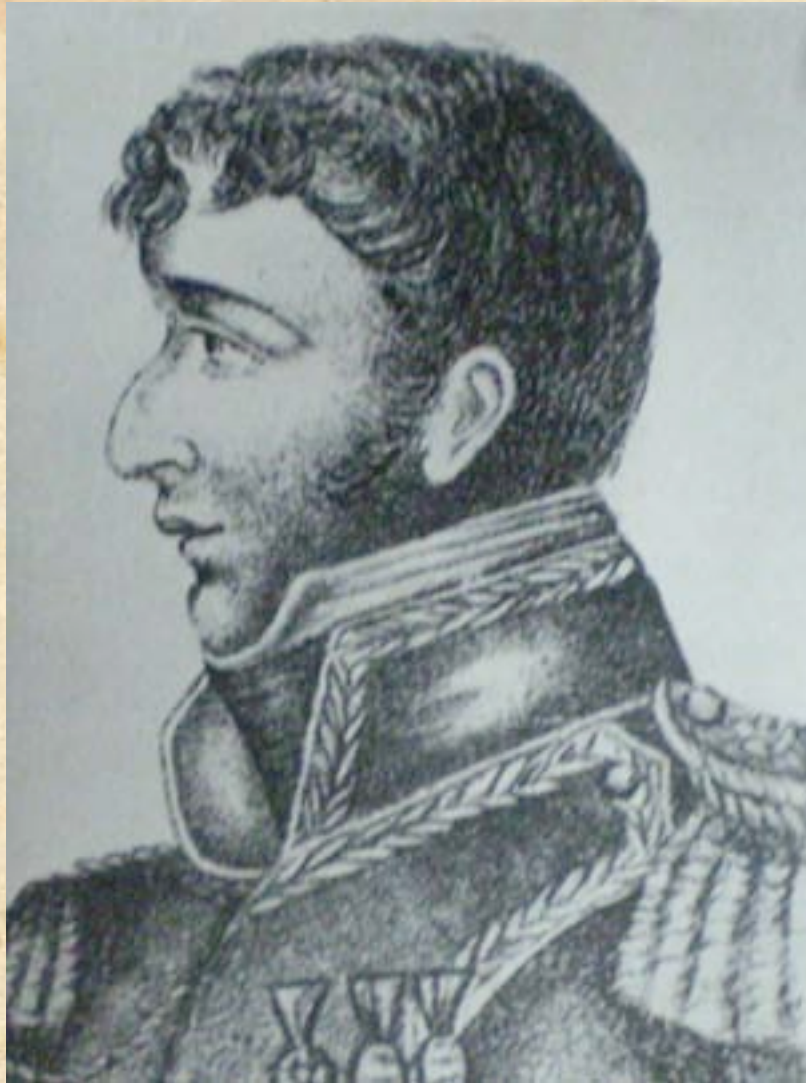
(5) General Antonio González Balcarce.