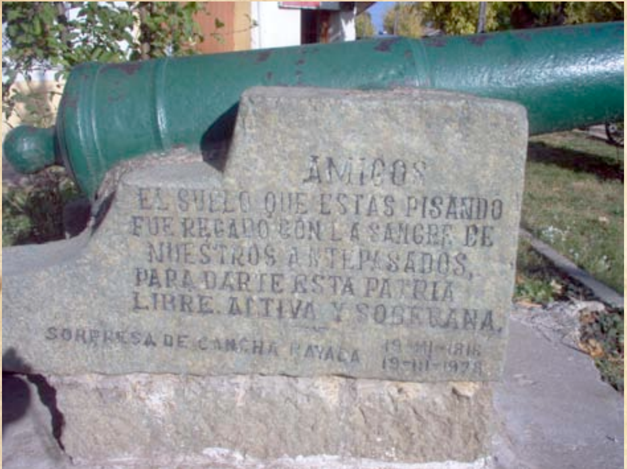
(15) Pieza de artillería con placa recordatoria de Cancha Rayada. (Fotos actuales del campo de combate).