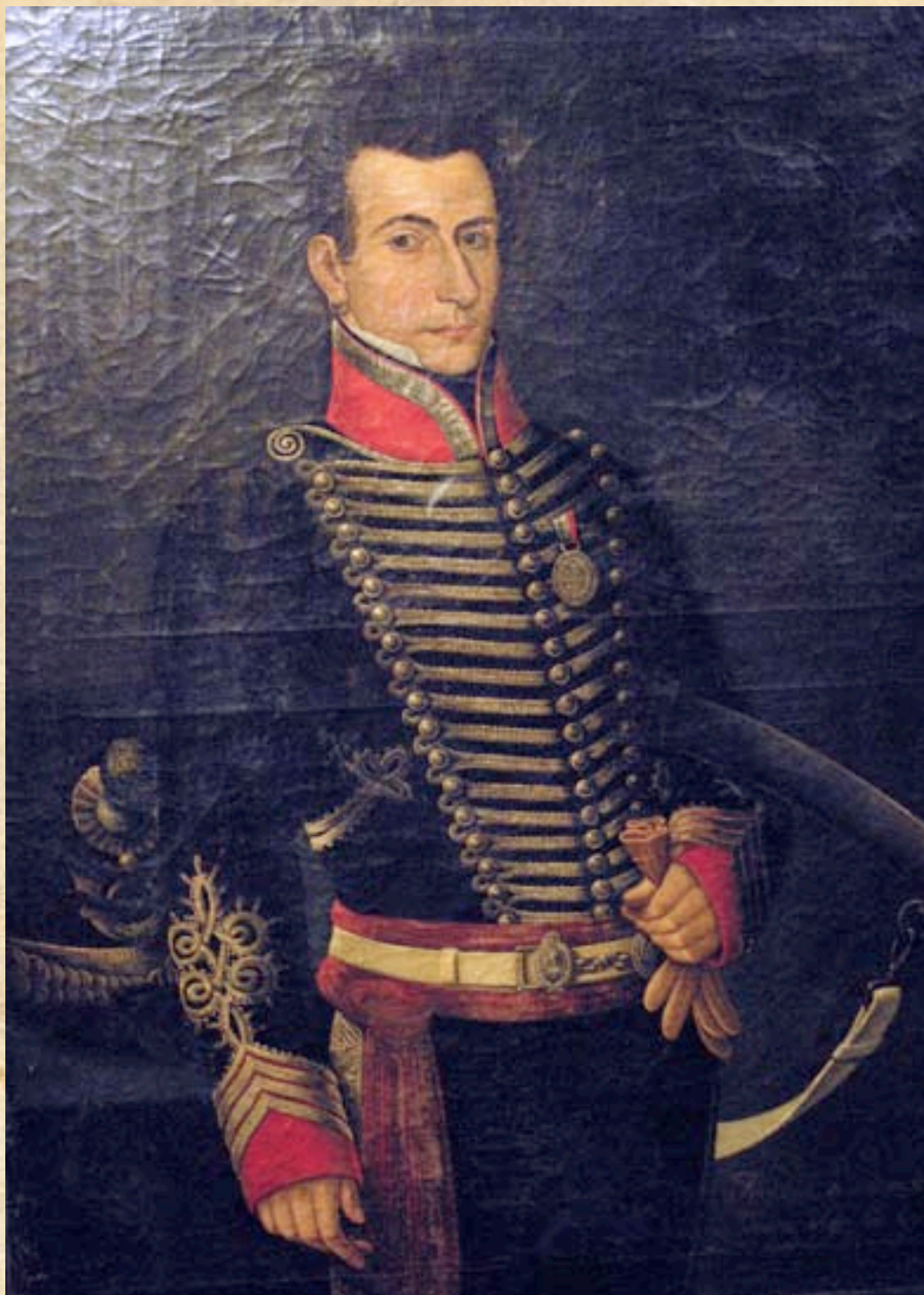
(6) Uniforme de Cazadores a Caballo: General Rufino Guido cuando sirvió en este destacado cuerpo.