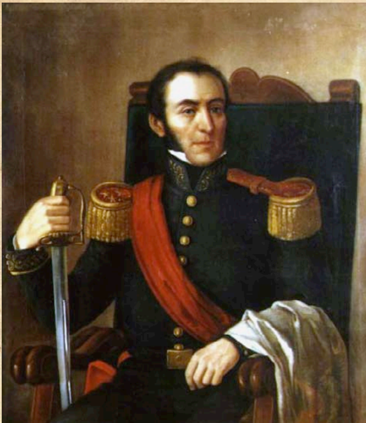
(3) Brigadier Mariano Osorio. Prefirió quedarse en Talca y no conducir el ataque nocturno a los patriotas.