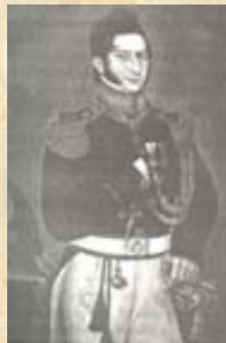
(8) Coronel Pedro Conde. Junto con el Coronel Las Heras, logró salvar a la División, en ausencia del Coronel de la Quintana.