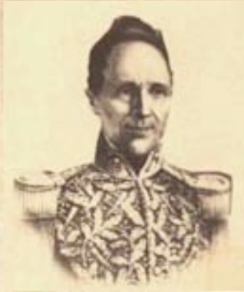
(11) General José Manuel Borgoño, Jefe de la Artillería Chilena en Cancha Rayada.