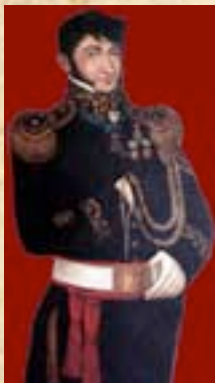
(7) Brigadier General Hilarión de la Quintana. Estaba yendo al Cuartel General cuando se produjo el ataque realista.