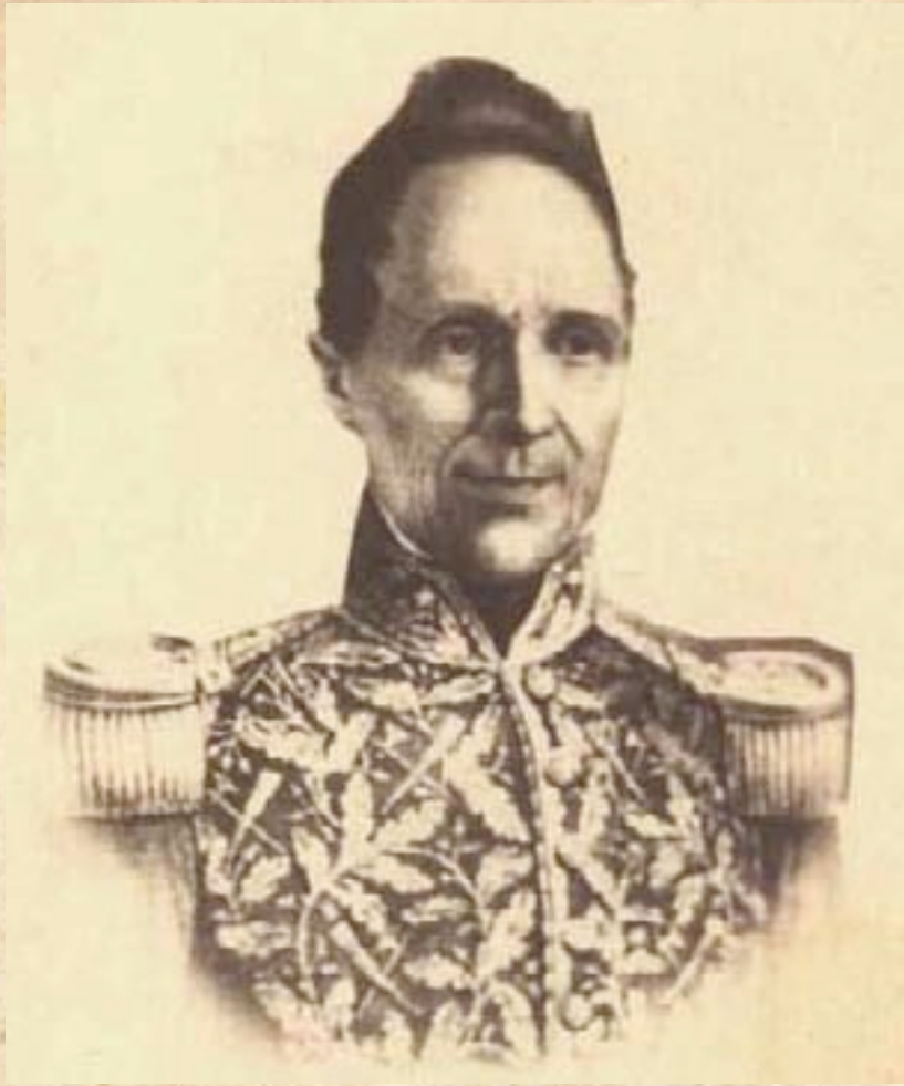
(11) General José Manuel Borgoño, Jefe de la Artillería Chilena en Cancha Rayada.