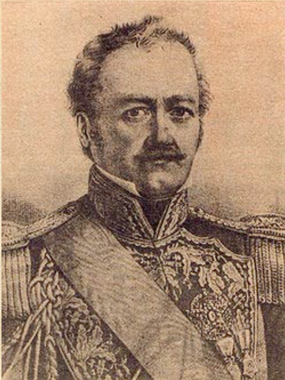
(4) General Ramón Freire. Era el Jefe de los Escuadrones de Cazadores de Chile.