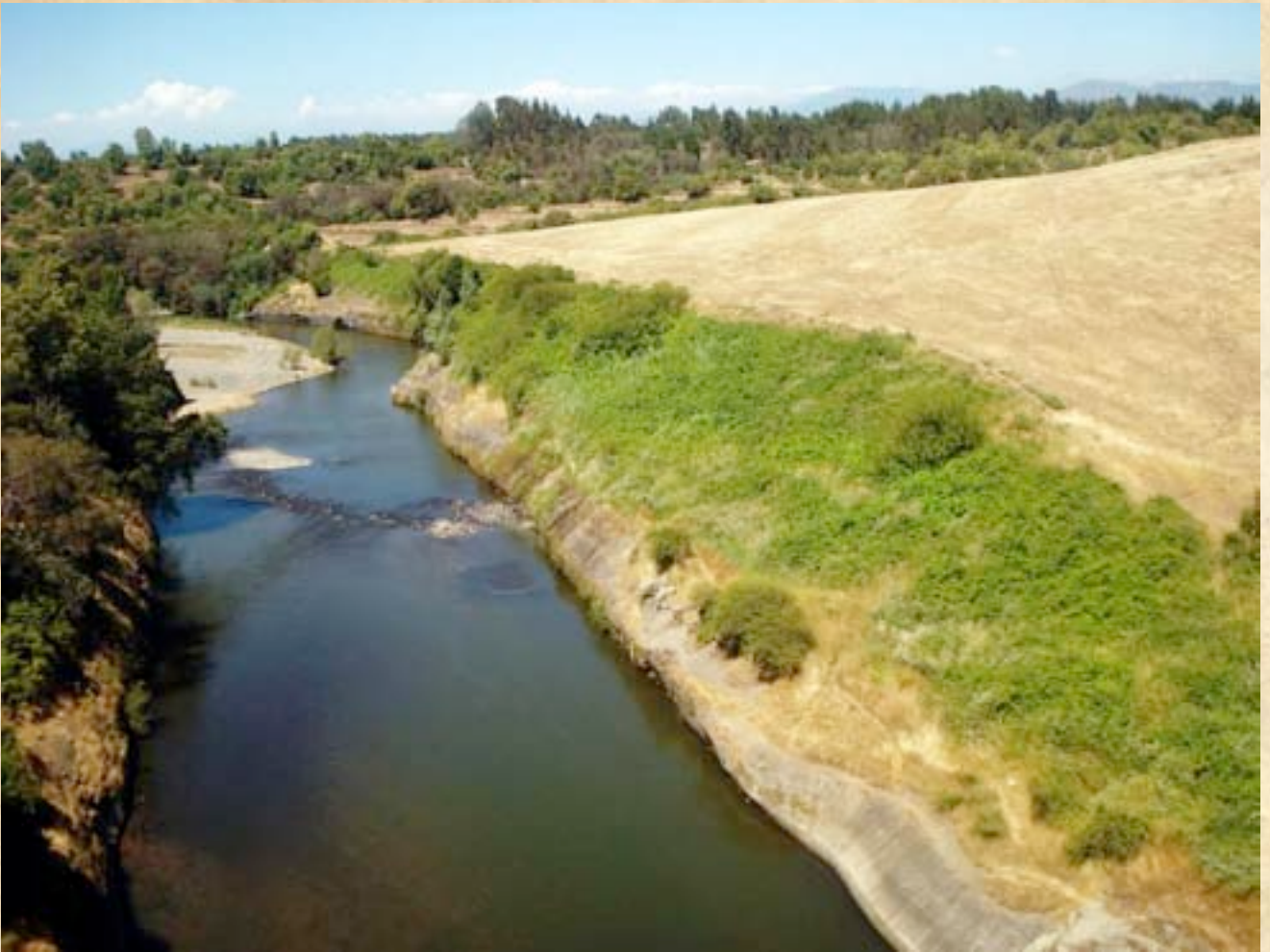
(14) Río Claro. Al sur de la confluencia de los ríos Claro y Lircay se forman los Llanos de Talca.