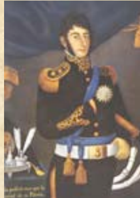
(2) General José de San Martín. Estaba recorriendo el Hospital de Sangre, cuando se produjo el ataque al campamento patriota.