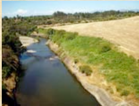
(14) Río Claro. Al sur de la confluencia de los ríos Claro y Lircay se forman los Llanos de Talca.