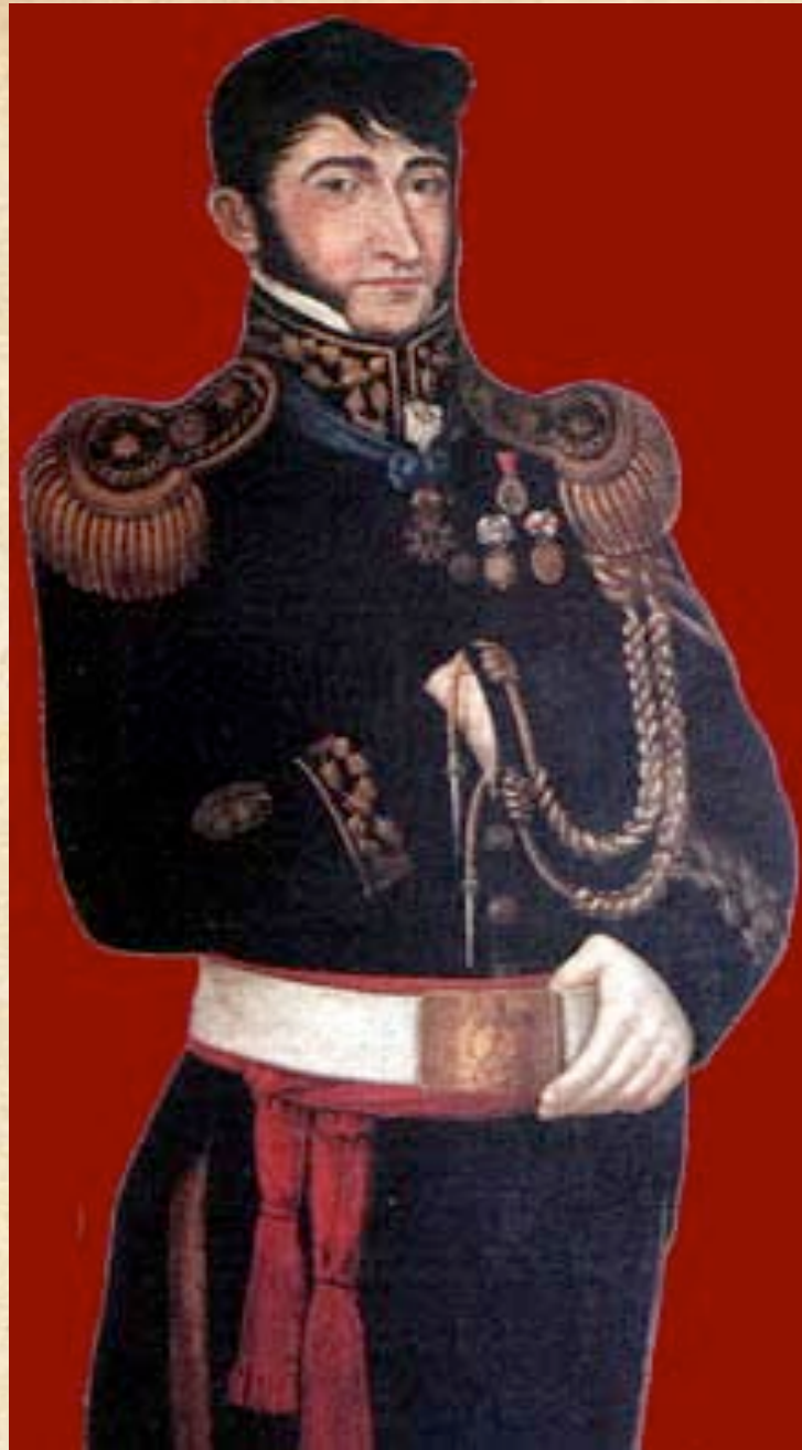
(7) Brigadier General Hilarión de la Quintana. Estaba yendo al Cuartel General cuando se produjo el ataque realista.