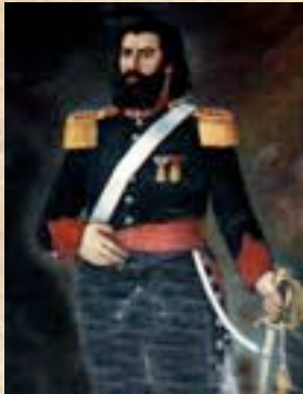
(13) Teniente Coronel Santiago Bueras y Avaria. Protegió con valor y destreza la retaguardia patriota con Granaderos a Caballo y Cazadores. Fue muerto en Maipú.