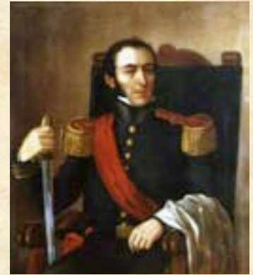
(3) Brigadier Mariano Osorio. Prefirió quedarse en Talca y no conducir el ataque nocturno a los patriotas.