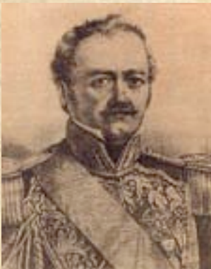
(4) General Ramón Freire. Era el Jefe de los Escuadrones de Cazadores de Chile.