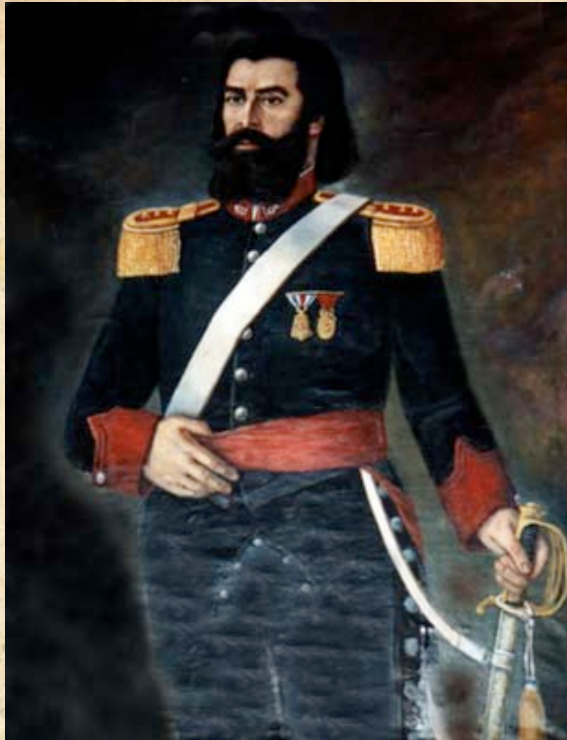
(13) Teniente Coronel Santiago Bueras y Avaria. Protegió con valor y destreza la retaguardia patriota con Granaderos a Caballo y Cazadores. Fue muerto en Maipú.