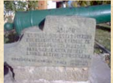
(15) Pieza de artillería con placa recordatoria de Cancha Rayada. (Fotos actuales del campo de combate).