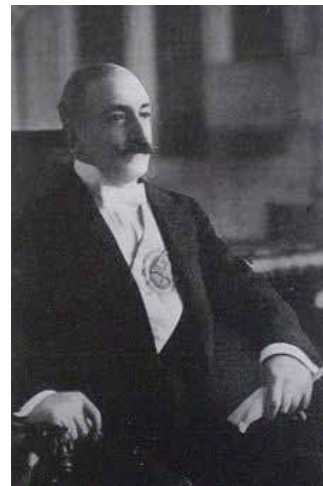
Presidente L. Saenz Peña

El que lleva adelante por primera vez esta idea es Domingo Faustino Sarmiento ( ex Gran Maestro de la Masonería Argentina) como candidato a presidente por el Partido Republicano en el año 1877, y posteriormente es la gran lucha desarrollada por Leandro N. Alem ( ex Gran Maestro de la Masonería Argentina), en la Revolución del 90 y 93 y culmina con la Ley Sáenz Peña (también Masón), que permite el acceso del Dr. Hipólito Yrigoyen (Masón) a la presidencia de la República.