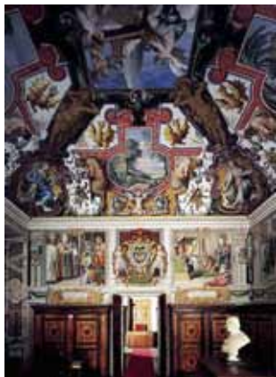
Interior del Vaticano

Nicolás Breglia – El diferendo planteado entre ambos sectores de la Iglesia tuvo una larga disputa, definiéndose a favor de la Autoridad del Vaticano cuyo resultado se plasmó en el Concilio Vaticano I, (1869/1870), donde la soberanía de la Iglesia la tiene definitivamente el Papa con la aparición del principio de la "infalibilidad Pontificia".