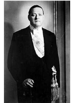
Roberto M Ortiz

Luego Hipólito Yrigoyen, su padre era un vasco francés casi analfabeto y un caso emblemático como Victorino de la Plaza que era de una condición social muy humilde llegó a ser presidente de la Nación y cuando se retira que prácticamente no tenía recursos y Don Hipólito Yrigoyen lo nombra miembro de la Corte.