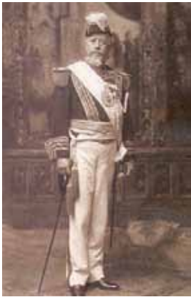
Julio A. Roca