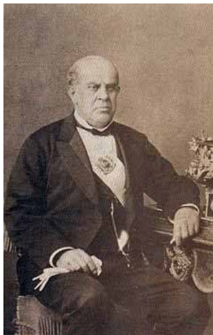
Domingo F. Sarmiento

Este concepto que era el que tenía la Orden en el Siglo XIX fue evolucionando hacia un criterio de la necesidad de implantar en el país el sufragio universal secreto y obligatorio, para eliminar los caudillismos locales y el fraude electoral. Se plantea el principio revolucionario de un ciudadano un voto.