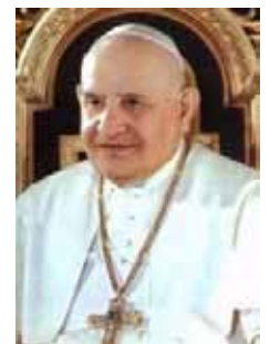
Grabado de Juan XXIII