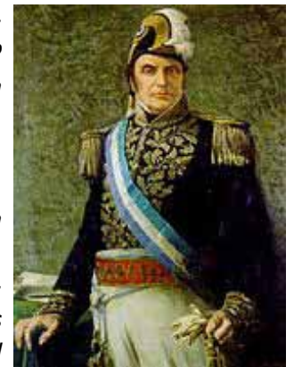
Justo José de Urquiza

En cambio el concepto federal plantea ideas adaptadas a la realidad. Parten de una visión de una Argentina real; la Argentina caudillesca; hispánica, que es la Argentina que viene con los Estados federales que son preexistentes a la Nación y además porque existen oligarquías locales y aristocracia que hay que respetar. Del federalismo deriva el Autonomismo, el Partido Radical, la Democracia Progresista y el Peronismo.