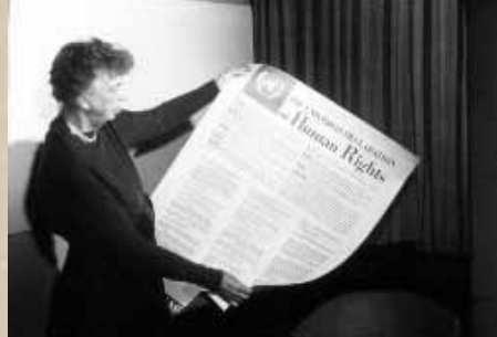
Eleanor Roosevelt observando texto final de la Declaración de las Naciones Unidas

Esta Comisión estuvo bajo la presidencia de la Sra. Eleanor Roosevelt, viuda del presidente estadounidense Franklin D. Roosevelt, y contó con personalidades tales como René Cassin (Francia), Charles Malik (Líbano), Peng Chun Chang (China), Hernán Santa Cruz (Chile), Alexandre Bogomolov y Alexei Pavlov (Unión Soviética), Lord Dukeston y Geoffrey Wilson (Reino Unido), William Hodgson y John Humphrey (Canadá). En esta Comisión se estableció un comité de redacción con el único