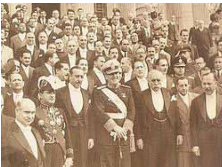
Perón -Quijano - 1946

Esta Gran Logia se crea como protección del exilio republicano español. Lo mismo ocurre en Méjico. En cambio la Masonería de la denominada línea de Cangallo, ubicada en la calle Juan Domingo Perón 1242, mantiene durante el primer gobierno de Perón una posición contemplativa y comprensiva.