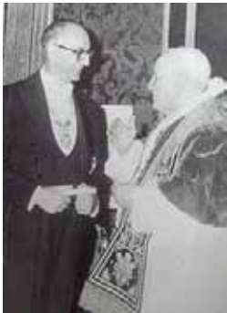
Arturo Frondizi con Juan XXIII

Nicolás Breglia – No puedo afirmar que sea influencia de la Masonería, pero nosotros consideramos que el Concilio Vaticano II -1962/1965- ha sido el avance más importante del siglo XX con la incorporación de temas que fueron planteados por la Masonería.