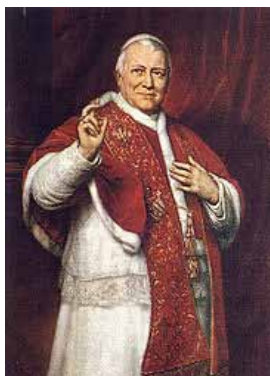
Papa Pio IX

Otro tema que alimentó el enfrentamiento de ambas instituciones fue el que planteó el Papa Pio IX, referido al concepto de "laicidad".