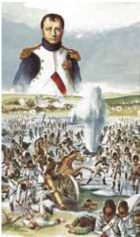
Batallas de Bonaparte