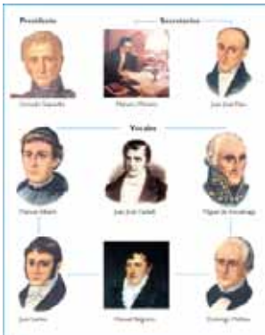
Primera Junta de Mayo

Pudiendo ponerse de acuerdo con los candidatos a integrarla. El que redactó la lista con los nombres de los integrantes de la Junta de Gobierno fue don Antonio Beruti.