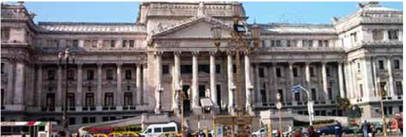
Sistema de Gobierno Republicano