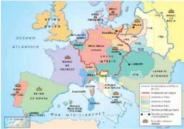
Mapa de Europa

JAB – ¿La invasión napoleónica agudizó la crisis del imperio español e impactó de manera contundente en el Río de la Plata. Frente a este nuevo escenario internacional, como actuaron Instituciones como la Masonería Argentina y la Iglesia Católica durante la Revolución de Mayo?