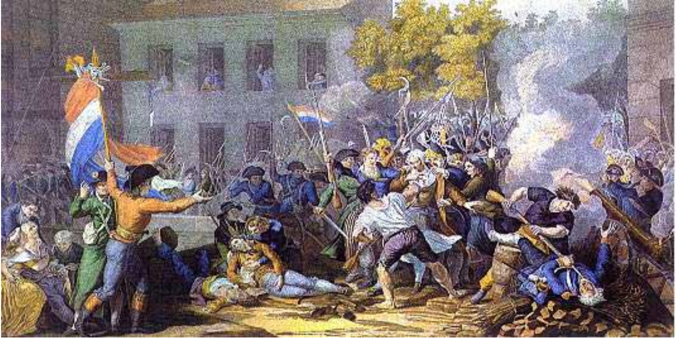
Toma de la Bastilla