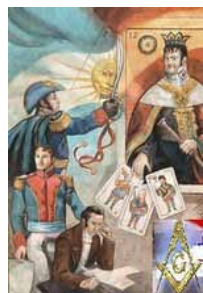
Masonería en la Revolución de Mayo