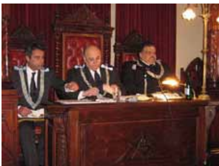
Maestre y Pro Gan Maestre presidiendo una reunión masónica