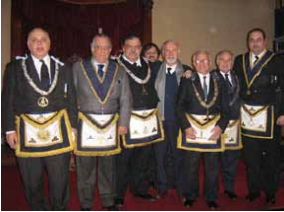
Autoridades de la Gran Logia de Libres y Aceptados Masones

Hay integrantes de la Orden que pueden poner el acento en la LIBERTAD, en consecuencia, su pensamiento va a coincidir con el de centro derecha. Hay otros que podrán poner el acento en la IGUALDAD, en este otro caso, su pensamiento va a coincidir con el de centro izquierda. Ambos están contenidos dentro de la Masonería. Pero la Orden tiene límites, no contiene a quienes pregonan las dictaduras, tanto del proletariado, el stalinismo, como las ideas fascistas, el falangismo o el nacional socialismo. Dentro de una Logia conviven en armonía hombres con diferentes pensamientos. Por ello, para el masón, la persona que piensa diferente no es un enemigo, sino, un adversario circunstancial con el que se pueden acordar