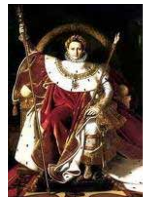
Napoleon como Emperador

Este nuevo escenario planteó posturas totalmente antagónicas: la sostenida por el Obispo Benito de Lué y Riega, que militaba activamente en el Partido de los Españoles, defensor del absolutismo monárquico, que negó enfáticamente el derecho de los americanos para hacer innovaciones en el gobierno ya que las Indias era propiedad de España y en consecuencia, mientras exista un español en América era el que debía gobernarla. La soberanía del gobierno residía en España y era privativa de los españoles. Esta postura es rebatida por Juan José Castelli; masón, que militaba en el Partido Patriota.