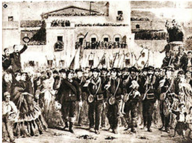
La Batalla de Pavón

Después, Buenos Aires envía diputados al Congreso que se va a hacer en Santa Fe y allí se arma el conflicto de la Batalla de Pavón. Y surge el denominado misterio de la Batalla de Pavón, aunque en realidad para nosotros, los masones, no existe ningún misterio porque cuando se enfrentan en Pavón Mitre y Urquiza, ambos pertenecían a la misma logia.