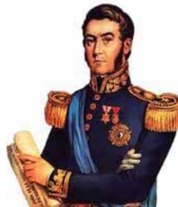
Grl. San Martín

El General San Martín le solicitó cuando se desempeñó como Gobernador intendente de la Provincia de Mendoza, que le preparase el programa educativo para aplicarlo en la provincia. Este clérigo se dedicó a la política, militó en el Partido Unitario, fue diputado Nacional, participó en la redacción de los proyectos constitucionales del 1819 y 1826. En el año 1835, participó en la terna para nombrar obispo de Buenos Aires, fue nombrado Mariano Medrano. En el ocaso de su vida volvió a su Tucumán natal, y allí bautizó a su sobrino bisnieto Nicolás Avellaneda, futuro presidente de la Nación.