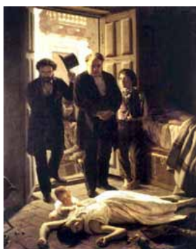
Dr. Roque Pérez y Dr. Cosme Argerich ocupados por la fiebre del cólera