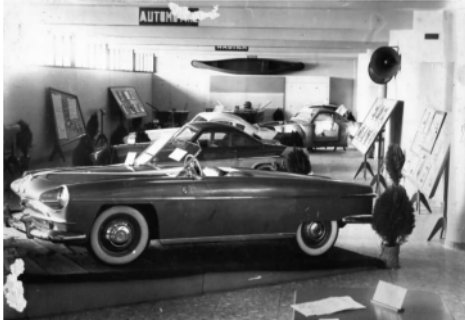
Automovil Justicialista Graciela Sport desarrollado y fabricado en Fábrica Militar de Aviones -FMA- de Córdoba en 1951.