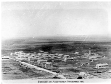
Vista de la Fábrica Militar de Aviones -FMA- ciudad de Córdoba en 1930.