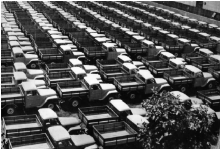
Flota de Rastrojero Justicialista desarrollado y fabricado en Fábrica Militar de Aviones -FMA- de Córdoba en 1952.

la fabricación de tractores, automóviles y motocicletas.