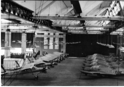
Flota de Aviones Moranne Souliers y Ranqueles desarrollado y fabricado en Fábrica Militar de Aviones -FMA- de Córdoba en 1953.

Aeronáuticas: N° 1 en BAM El Palmar, N° 2 en BAM Los Tamarindos, N° 3 Guarnición Militar Paraná. El Grupo N°1 de Bombardeo Pesado en BAM Paraná y el Grupo N°1 de Caza instalado en el IV Grupo de Observación.