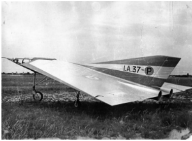
Prototipo IA 37 Ala Delta desarrollado y fabricado en Fábrica Militar de Aviones -FMA- de Córdoba en 1950.

gresar de su viaje a Europa, la formación de una unidad de guerra que realizara ejercicios de cooperación con las tropas terrestres a fin de cumplir las prestaciones establecidas en el “Reglamento de Conducción y Combate” que en esa época se pone en vigencia.